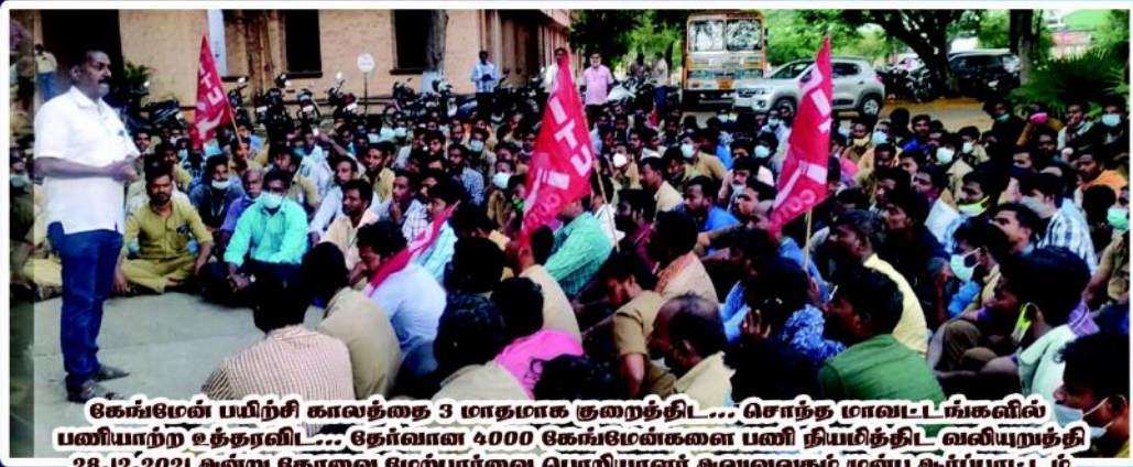
கேங்மேன் பயிற்சி காலத்தை 3 மாதமாக குறைத்திட... சொந்த மாவட்டங்களில் பணியாற்ற உத்தரவிட... கேங்மேன் 4000 கேங்மேன்களை பணி நியமித்திட வலியுறுத்தி 28.12.2021 அன்று கோவை மேற்பார்வை பொறியாளர் அலுவலகம் முன்பு ஆர்ப்பாட்டம்