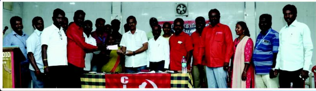
28.12.2021 அன்று சென்னை தெற்கு 2 கிளையில் கேங்மேன் கோரிக்கை மாநாடு நடைபெற்றபோது 2022 ஆம் ஆண்டின் சந்தா 500-ஐ மாநில பொதுச் செயலாளரிடம் ஒப்படைக்கப்பட்டது