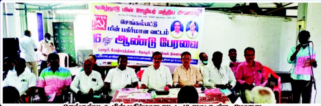
செங்கல்பட்டு மின் பகிர்மான வட்டம் 16 வது ஆண்டு பேரவை