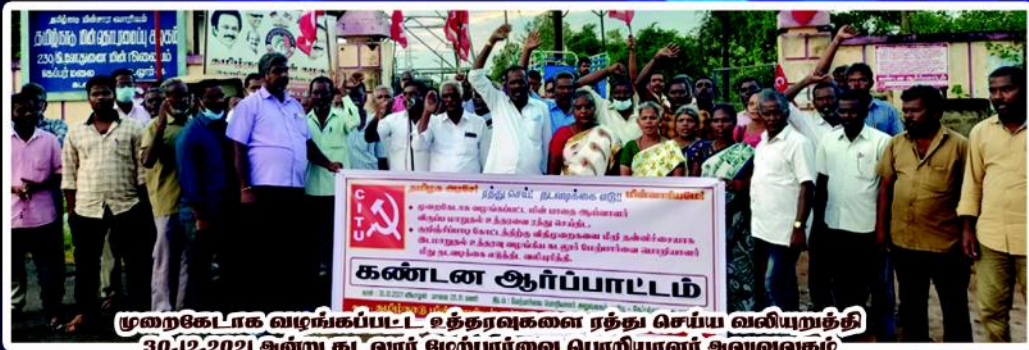
முறைகேடாக வழங்கப்பட்ட உத்தரவுகளை ரத்து செய்ய வலியுறுத்தி 30.12.2021 அன்று கடலூர் மேற்பார்வை பொறியாளர் அலுவலகம் முன்பு ஆர்ப்பாட்டம்